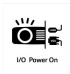
I/O Power On

Mit der HDMI Power On Funktion ist der Projektor in der Lage sich automatisch einzuschalten, sobald der Projektor ein Signal per HDMI oder VGA zugespielt bekommt. Sie brauchen den Projektor nicht mehr separat zu starten, sondern können einfach ihr Notebook, ihren Receiver oder die Spielekonsole einschalten und der Projektor schaltet sich automatisch ebenfalls ein.