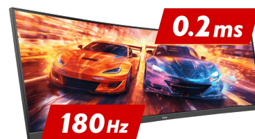
180Hz & 0.2ms MPRT

Die Fast IPS Technologie garantiert nicht nur lebendige Schlachtfeldszenen mit hoher Farbtreue, sondern auch eine ultraschnelle Reaktionszeit von nur 0.2ms (MPRT) für bewegte Bilder.