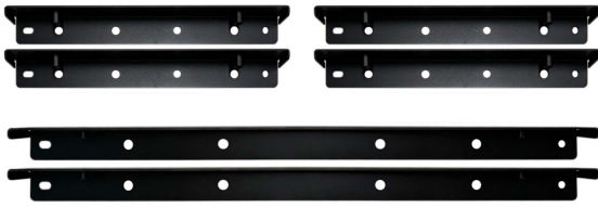
MOUNTING BRACKETS KIT