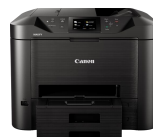
MAXIFY MB5450 Modelle